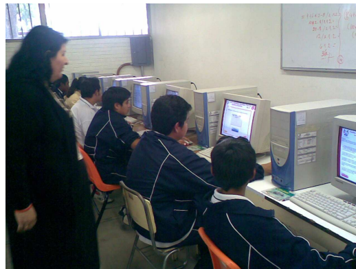
Fig. 2 Maestra de la asignatura de Lectura, Expresión Oral y Escrita evaluando los resultados de sus alumnos mediante el SAEIC.