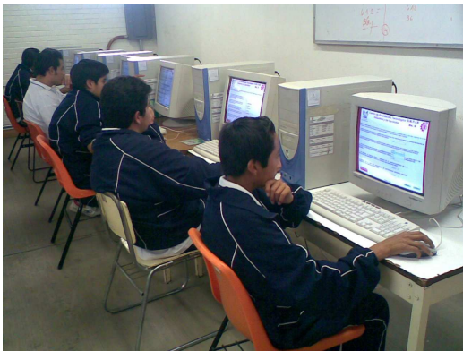
Fig. 1 Estudiantes de 1er semestre de Bachillerato, presentado su examen de Lectura, Expresión Oral y Escrita utilizando el SAEIC.

La totalidad de los participantes opinó que este tipo de tecnología era muy útil y necesaria, que les agradaría poder aplicar este sistema en todas sus materias y que consideraban viable, en definitiva, aplicar este sistema para llevar a cabo las evaluaciones de la mayor parte de sus materias teóricas.